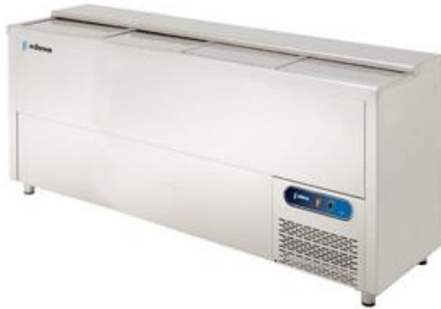
Refrigeração Comercial - Refrigeradores de garrafas - Refrigeradores de garrafas da série EB