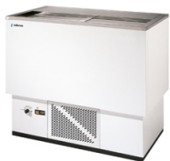
Resfriadores de garrafa série EBE