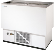
Resfriadores de garrafa série EBE