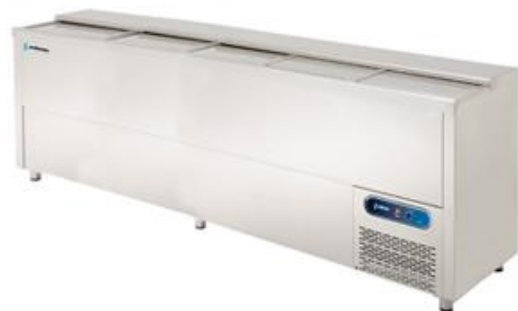
Refrigeração Comercial - Refrigeradores de garrafas - Refrigeradores de garrafas da série EB