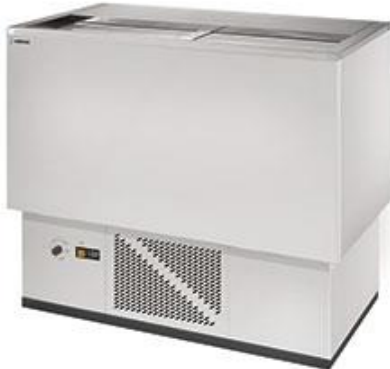
Refrigeração Comercial - Refrigeradores de garrafas - Resfriadores de garrafa série EBE