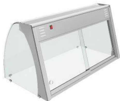
Distribuição e exposição de alimentos - Drop-In - Vitrinas expositoras