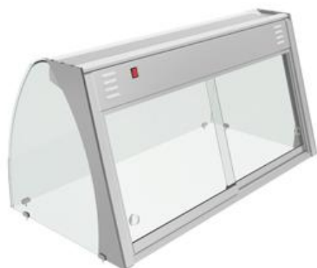
Distribuição e exposição de alimentos - Drop-In - Vitrinas expositoras