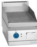
Planchas fry-tops eléctricas