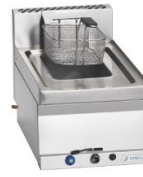
Freidoras a gas