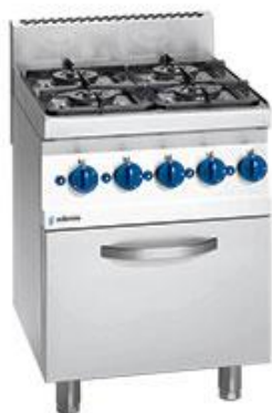
Cocción y Hornos - Snack 650 - Cocinas a gas con horno