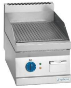
Planchas fry-tops a gas