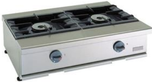
Cocción y Hornos - Snack 550 - Cocinas a gas