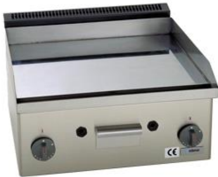
Cocción y Hornos - Snack 550 - Planchas fry-tops a gas