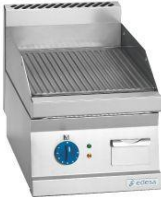
Cocción y Hornos - Snack 650 - Planchas fry-tops a gas