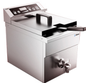
Freidoras de inducción