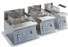
Freidoras profesionales de sobremesa