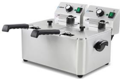
Cocción y Hornos - Freidoras sobremesa - Freidoras de sobremesa