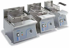
Freidoras profesionales de sobremesa