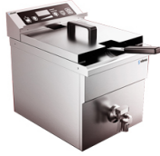
Freidoras de inducción