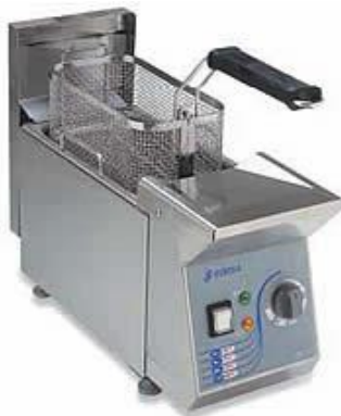
Cocción y Hornos - Freidoras sobremesa - Freidoras profesionales de sobremesa