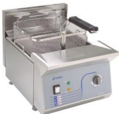
Cocción y Hornos - Freidoras sobremesa - Freidoras profesionales de sobremesa