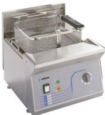
Cocción y Hornos - Freidoras sobremesa - Freidoras profesionales de sobremesa