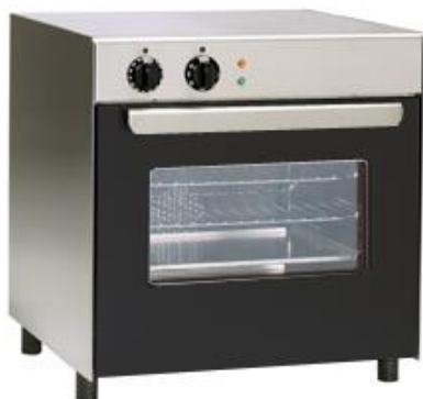
Cocción y Hornos - Hornos - Horno a convección