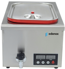
Sous Vide Baño María estático