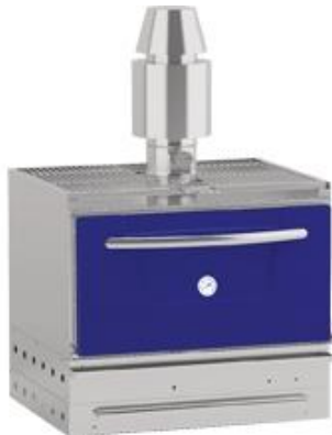
Cocción y Hornos - Hornos - Hornos de brasa