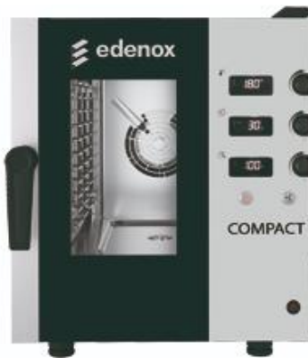
Cocción y Hornos - Hornos - Horno compacto - Horno Compact