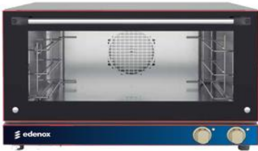
Cocción y Hornos - Hornos - Horno panadería