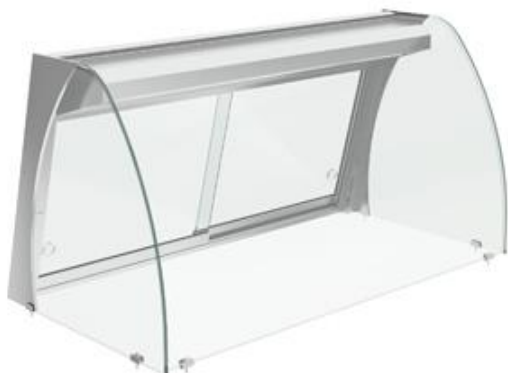
Distribuição e exposição de alimentos - Drop-In - Vitrinas expositoras