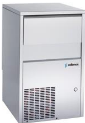
Refrigeração Comercial - Máquinas de gelo - Máquinas de gelo sólido em cubo