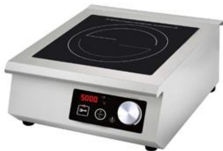
Cocción y Hornos - Inducción - Inducción sobremesa