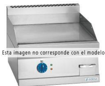
Esta imagen no corresponde con el modelo