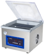
Envasadoras Vaksic serie E