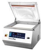
Envasadoras de sobremesa por sensor Sline Plus