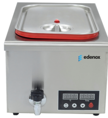
Sous Vide Baño María estático