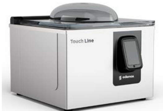
Preparación dinámica y conservación - Envasado al vacío - Serie CHEF TOUCH