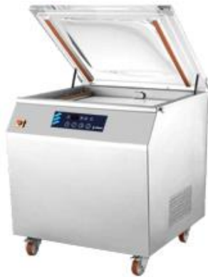
Preparación dinámica y conservación - Envasado al vacío - Envasadoras de pie por sensor