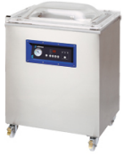
Envasadoras de pie por tiempo