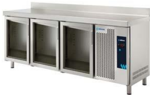
Frio Comercial - Mesas refrigeradas - Snack Serie 600 - Snack Serie 600 refrigerada puerta de cristal