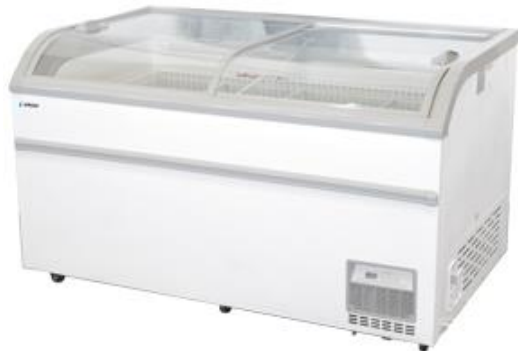
Frio Comercial - Congeladores horizontales - Islas de congelación profundidad 890 mm