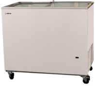
Horizontales puerta de cristal