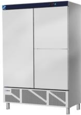
Frio Comercial - Armarios refrigerados en acero inox - Armarios Inox - Serie 700 - Armarios refrigerados