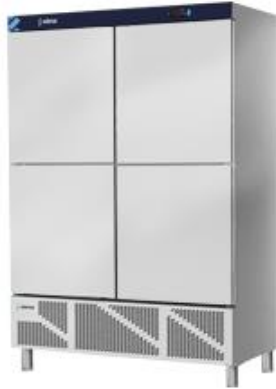
Frio Comercial - Armarios refrigerados en acero inox - Armarios Inox - Serie 700 - Armarios refrigerados