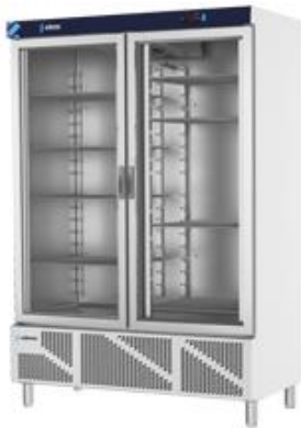
Frio Comercial - Armarios refrigerados en acero inox - Armarios Inox - Serie 700 - Armarios refrigerados con puerta de cristal