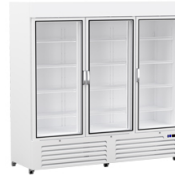
Armarios expositores Minimarket