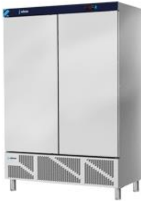
Frio Comercial - Armarios refrigerados en acero inox - Armarios Inox - Serie 700 - Armarios para mantenimiento de congelados