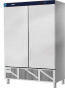
Armarios Inox - Serie 700 Armarios de alta eficiencia energética - Congelación