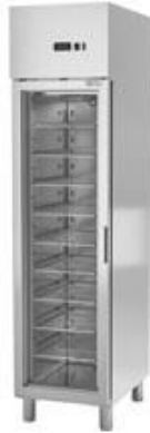
Frio Comercial - Armarios refrigerados en acero inox - Armario Inox - Serie GN 1/1 - Armario Inox - Serie GN 1/1