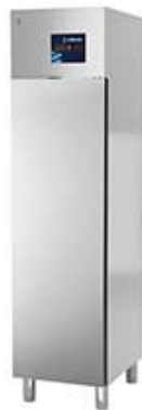
Frio Comercial - Armarios refrigerados en acero inox - Armario Inox - Serie GN 1/1 - Armario Inox - Serie GN 1/1