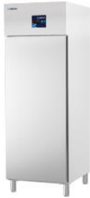
Frio Comercial - Armarios refrigerados en acero inox - Armario Inox - Serie 600 x 400 - Armario de mantenimiento de congelados - Serie 600 x 400