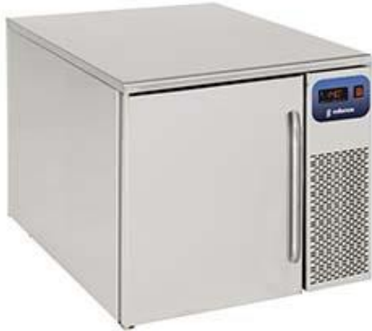
Frio Comercial - Abatidores de temperatura - Abatidor compacto 3 bandejas - GN 1/1