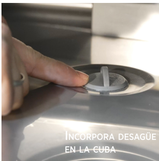
INCORPORA DESAGÜE EN LA CUBA