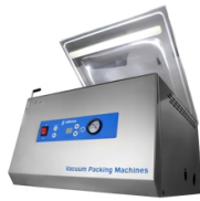
Envasadoras de sobremesa por tiempo Vaksic