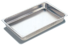
Recipientes GN de acero inoxidable Cubetas lisas sin asas