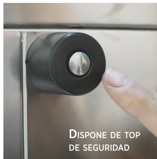
DISPONE DE TOP DE SEGURIDAD