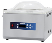
Envasadoras de sobremesa por sensor Sline