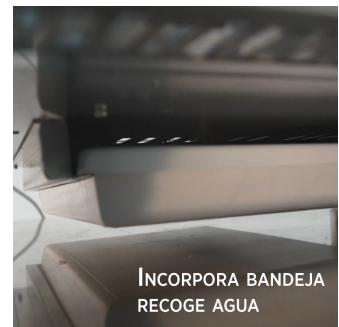
INCORPORA BANDEJA RECOGE AGUA