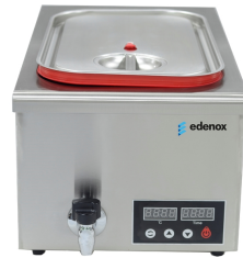
Sous Vide Baño María estático