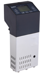
Sous Vide portátil