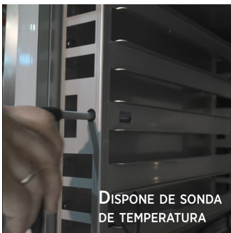
DISPONE DE SONDA DE TEMPERATURA