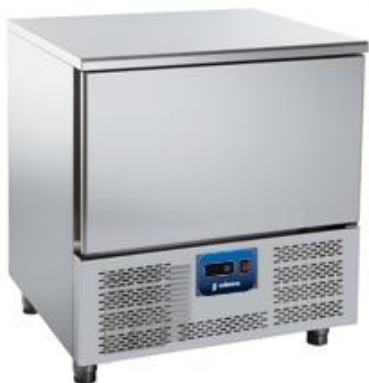
Frio Comercial - Abatidores de temperatura - Abatidor 5 bandejas - GN 1/1