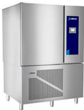
Frio Comercial - Abatidores de temperatura - Abatidores Serie GN 1/1 y GN 2/1 (8,10,16 bandejas)