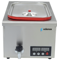
Sous Vide Baño María estático