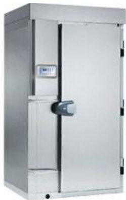
Frio Comercial - Abatidores de temperatura - Células de abatimiento 20 bandejas GN 1/1 y GN 2/1