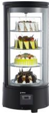
Frio Comercial - Vitrinas refrigeradas - Vitrinas expositoras de sobremesa - Vitrinas redondas de sobremesa