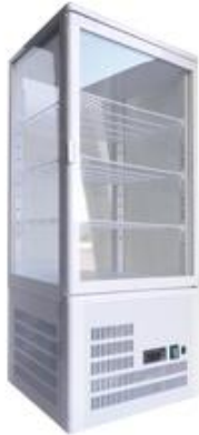
Frio Comercial - Vitrinas refrigeradas - Vitrinas expositoras de sobremesa - Vitrinas verticales de sobremesa