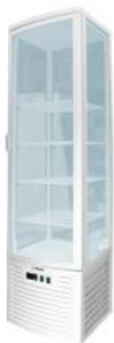
Frio Comercial - Vitrinas refrigeradas - Vitrinas refrigeradas verticales