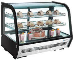
Vitrinas expositoras de sobremesa Vitrinas expositoras de sobremesa