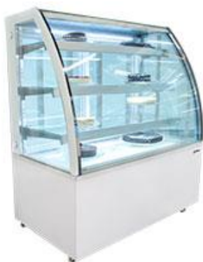
Frio Comercial - Vitrinas refrigeradas - Vitrinas expositoras pastelería - Cristal curvo