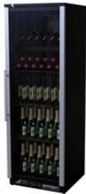
Distribución y exposición de alimentos - Vinacotecas - Armarios expositores de vino