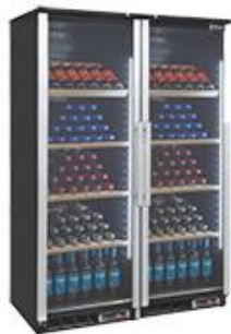
Distribución y exposición de alimentos - Vinacotecas - Armarios expositores de vino