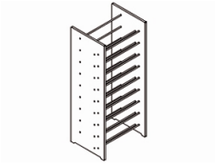
Vinacotecas ENOLUX Accesorios