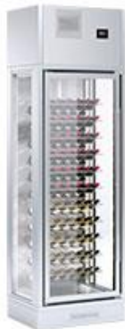
Distribución y exposición de alimentos - Vinacotecas - Vinacotecas ENOLUX