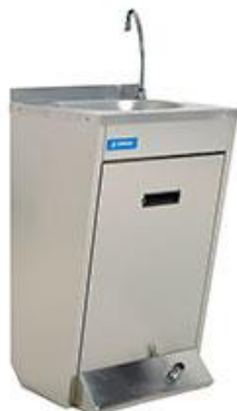
Preparación estática - Lavamanos - Lavamanos - De pie