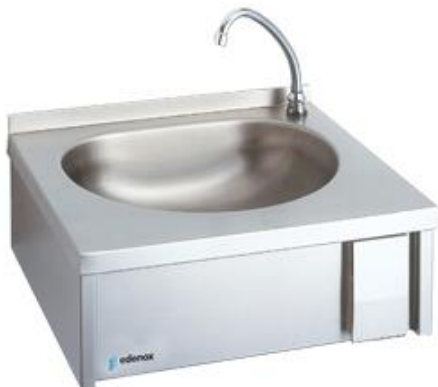
Preparación estática - Lavamanos - Lavamanos - Murales