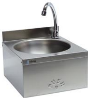
Preparación estática - Lavamanos - Lavamanos - Murales