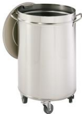
Preparación estática - Seguridad e higiene - Cubos para usos varios