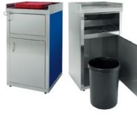
Contenedor de desperdicios