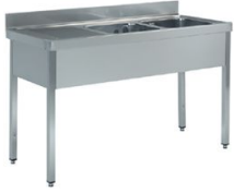
Fregaderos industriales Soldados a bastidor gama 600 y 700 - Gama lavavajillas