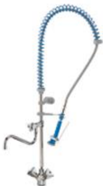
Preparación estática - Grifería industrial - Grifería industrial - Grifos ducha