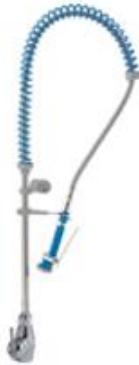
Preparación estática - Grifería industrial - Grifería industrial - Grifos ducha